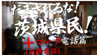
【動画その2イメージ】