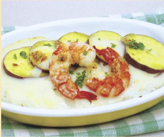
クッキングスクールネモト