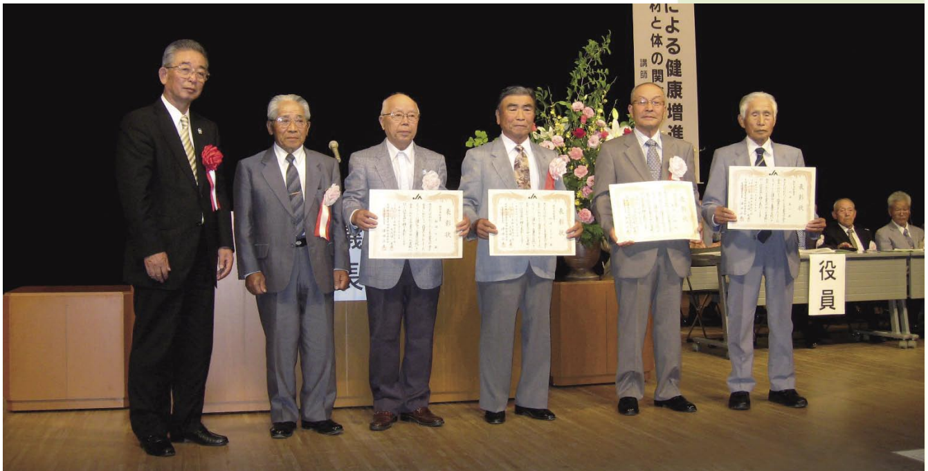
6月23日 年金友の会総会・特別高齢者表彰の模様