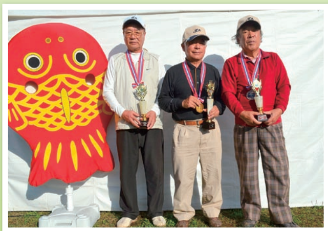
上位入賞者の皆さま (男性の部)